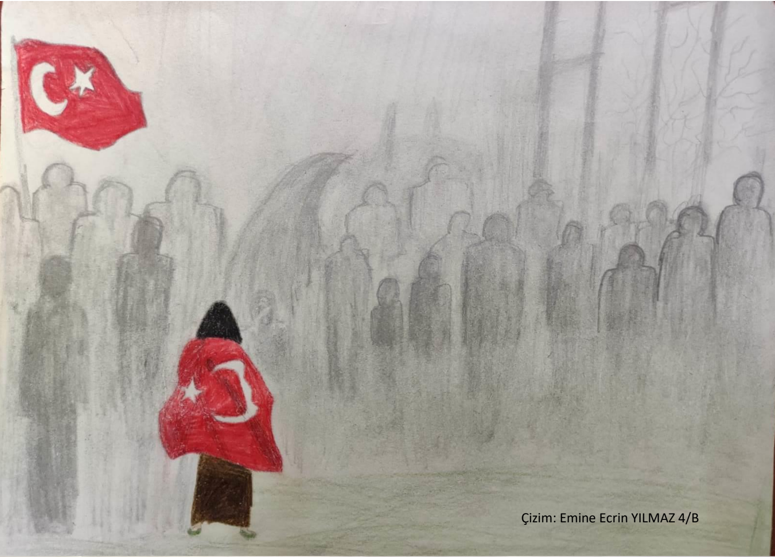
Çizim: Emine Ecrin YILMAZ 4/B